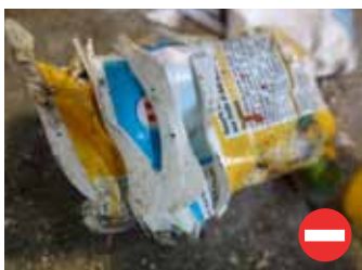
Pots de yaourts