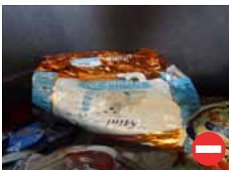
Emballage de beurre