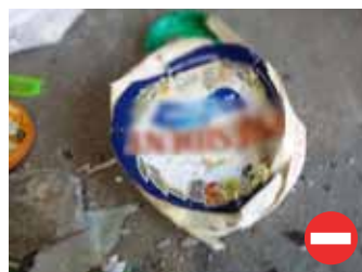
Boîte en bois