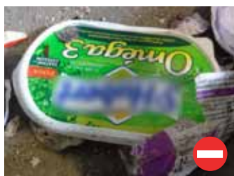
Boîte de beurre