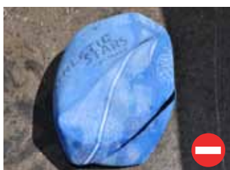
Ballon en plastique