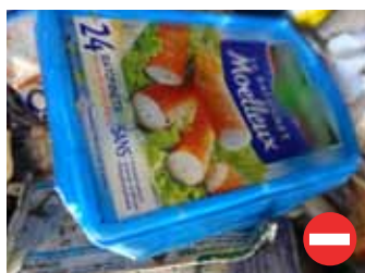
Boîte de surimis