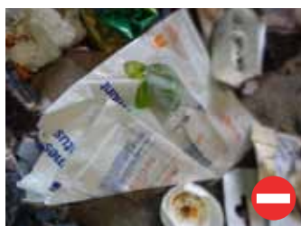
Paquet de bonbons