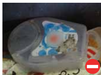
Boîte de vis